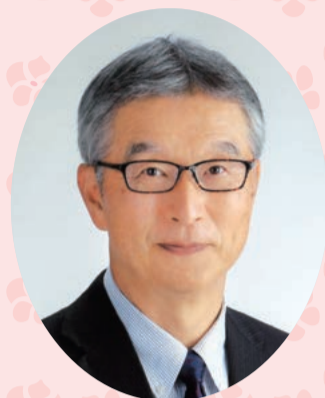
北条カントリー倶楽部