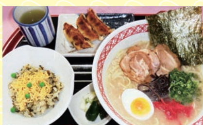
KAZAHAYA CUP 限定ランチ