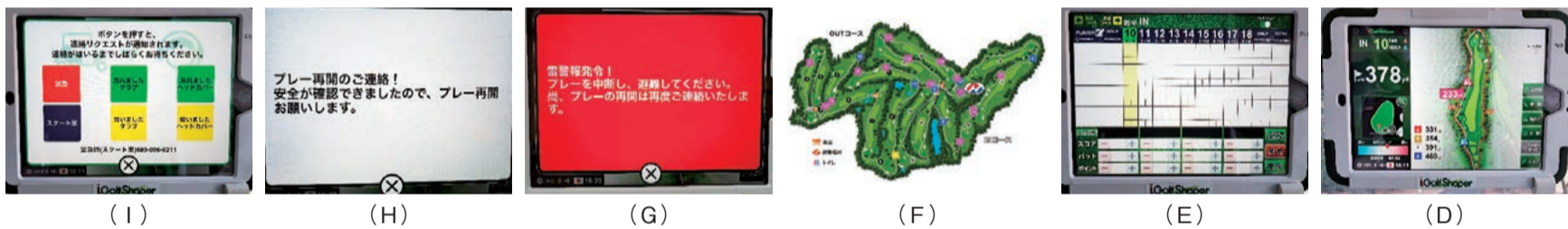
(I) (H) (G) (F) (E) (D)

※倶楽部競技ではカートナビが競技モードに設定されるため、一部の機能が自動的に停止しますのでご了承ください。