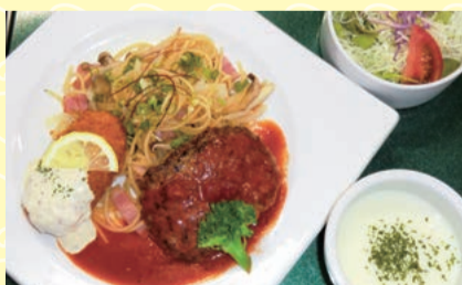
レディースデー限定ランチ

会員の皆様、新年あけましておめでとうございます。 レストランでは、おいしい料理をお出し、リフレッシュして頂ける場の提供が出来るよう日々心掛けております。 メニューに於ては季節に応じ変更や、毎月一度開催される当倶楽部主催のKAZAHAYA CUP カップ・Wednesdayカップ・レディースデーなどでその日しか味わうことのできない限定ランチをご用意し、お客様より好評を得ております。 今後も創意工夫を凝らし新しいメニューの提供や地産地消も取り入れ、ご休憩時により楽しんで頂く事が出来ますよう、接客も含めスタッフ一同努力して参ります。引き続き本年も何卒よろしくお願申し上げます。